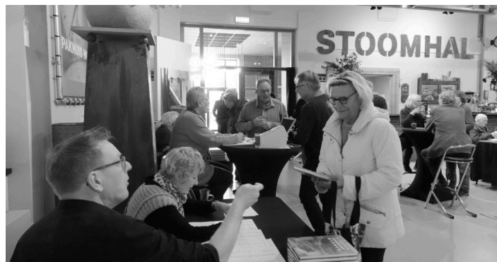
Genootschapsdag november 2022.