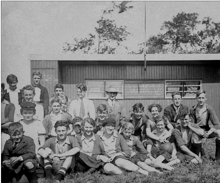
Het clubhuis van GroenGeel in 1929.

dat een korfbalvereniging in Wormer tot wasdom kon komen in een dorp waarvan veel inwoners niets moesten hebben van een gemengde sport of sporten op zondag? GroenGeel heeft een groot aantal niet spelende leden, die levenslang lid blijven, waarom word je GroenGeler voor het leven?