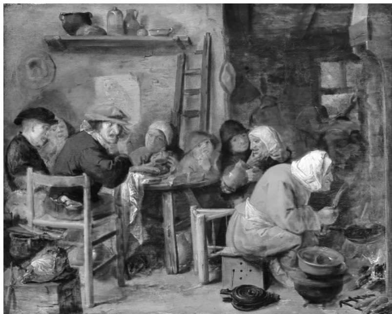
Adriaen Brouwer, Boerenmaaltijd .

Minimum deelname 20 personen. Wordt dit niet gehaald dan krijgt u uw geld terug. <