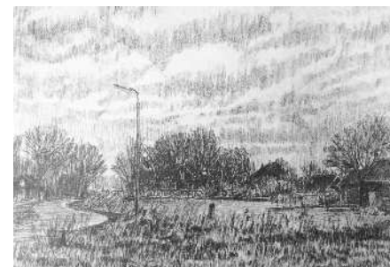
Zeefdruk van de Bartelsluisomgeving door Frans Room. COLLECTIE HISTORISCH GENOOTSCHAP WORMER

Alle schenkers hartelijk dank. Geschonken foto's en dia's zullen door onze fotowerkgroep worden gescand en ingevoerd in de beeldbank van het Waterlands Archief en daarna in beheer worden overgedragen aan dit archief. De overige objecten zullen wij goed bewaren en eventueel gebruiken. <