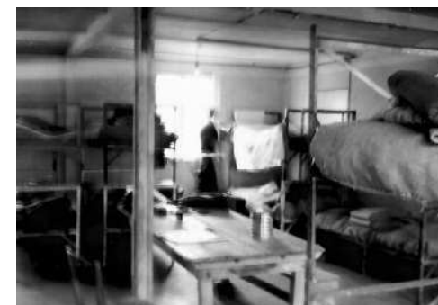
De slaapruijnte in de barak in Grafenstaden, Duitsland, 1943.