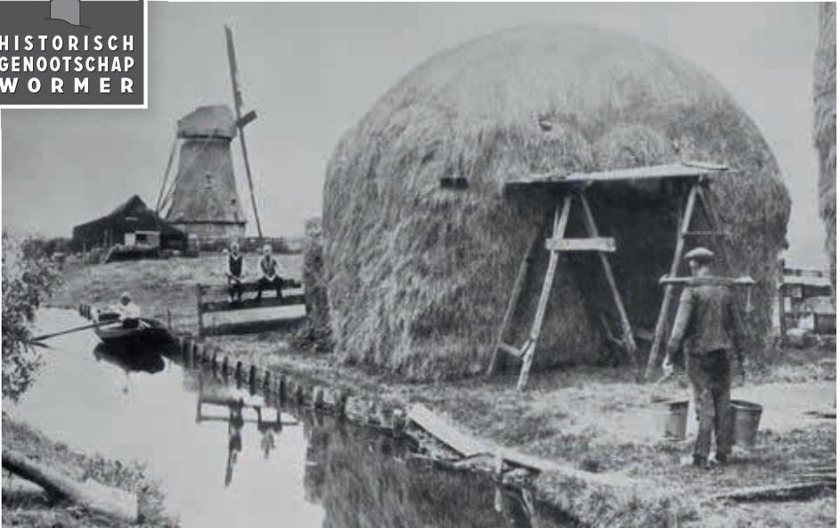
Opa Koomen met op de achtergrond molen de Koker, waar hij enige jaren molenaar was.