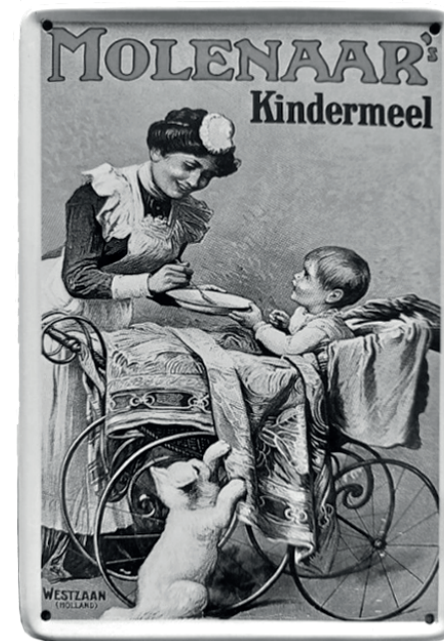
Blikken reclamebord van Molenaar's Kindermeel.

In 1947 overleed Opa. Het huisje aan het Oosteinde werd gesplitst. Zoon Cor betrok met zijn gezin het voormalige kantoortje van Opa.