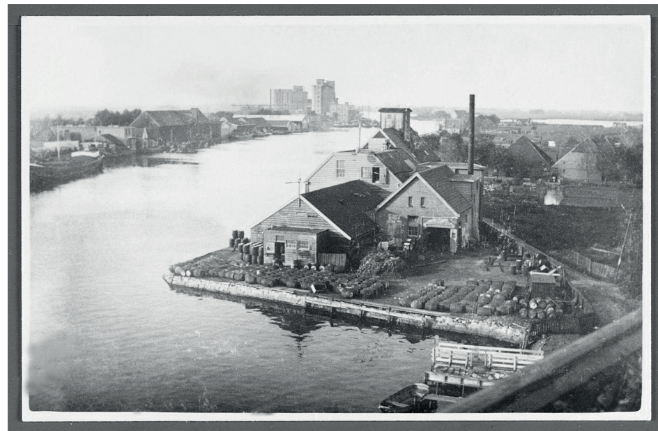
Olieslagerij De Mol van de firma Wildschut aan de Veerdijk.

In 1953 verscheen een bijzonder boekje ter gelegenheid van het 25-jarig bestaan van 'Gerkens', met trots geschreven door enkele personeelsleden. De ondertitel van het boekje luidt: De Mol als molen, olieslagerij en raffinaderij.