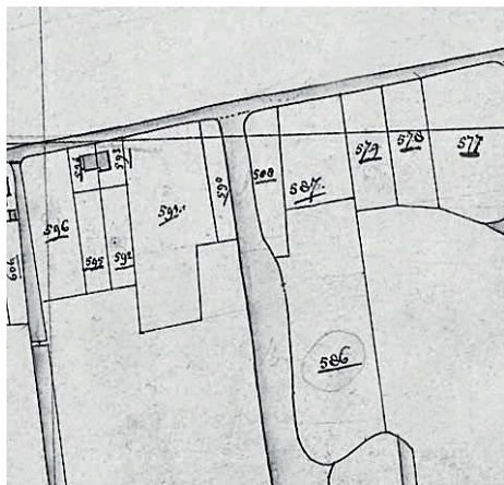
Fragment Oorspronkelijke Aanwijzende Tafel 1811-1832.