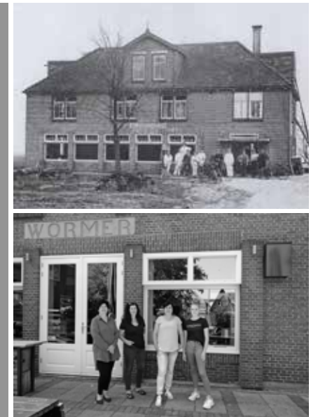
Een van de foto's uit het boek: personeel poserend voor de voormalige kaasfabriek en verenigingsgebouw, nu Café Groos.