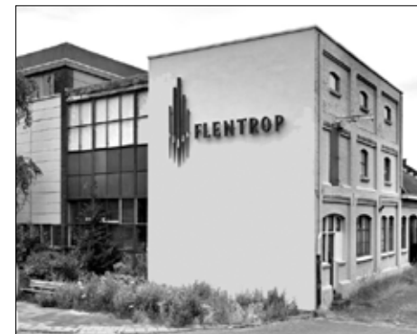
Flentrop orgelbouwers in Koog aan de Zaan.