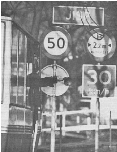
'De bel voor de laatste ronde. De bakker in Jisp luidt nog altijd de bel. Dat zal niet lang meer duren nu de Tweede Kamer Jisp, Wijdewormer en Wormer zal laten opgaan in een nieuwe gemeente Wormerland.'

In Wormer had het verzet tegen de samenvoeging – een meerderheid van de bevolking was tegen – zich verenigd in het comité 'Wormer buiten Zaanstad'. Als argument werd aangevoerd dat Zaanstad een typisch op industrie gerichte gemeente was, terwijl Wormer overwegend een landelijk karakter heeft en aansluit op de gemeente Jisp. In de herindelingsplannen werd Wormer zelfs in tweeën gedeeld. Het 'stedelijk' deel zou bij Zaanstad komen, het landelijk deel zou aan Jisp worden toegevoegd.