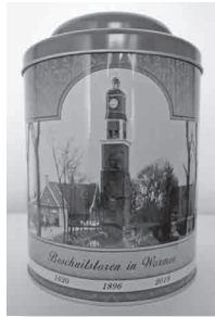
De beschuitbus.

D at de Open Monumentendagen zeer geslaagd zijn, heeft u op de pagina hiervoor kunnen lezen. Helaas waren we niet in staat het aangekondigde verrassingsgeschenk aan de leden uit te reiken. U zult inmiddels wel hebben gehoord dat het gaat om een fraaie beschuitbus, hierboven afgebeeld. Oorzaak: vertraging bij de levering. Maar het komt goed met de Genootschapsdag, verderop hierover meer.