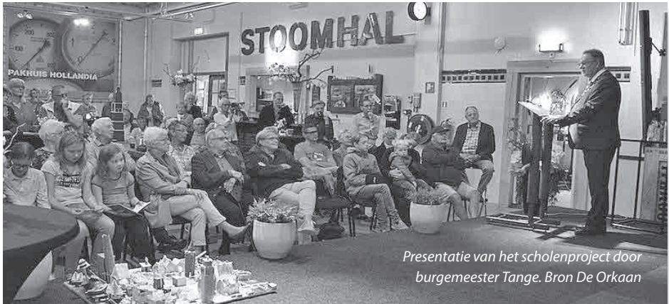
Presentatie van het scholenproject door burgemeester Tange.