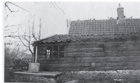
Impressie van het huis aan de Herenlaan.