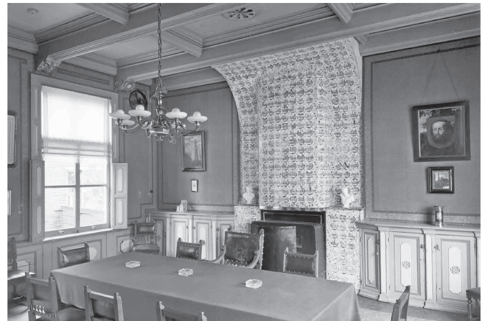
Onder: Links van de smuiger het schilderij van Postma, rechts onder het wapen van Wormer de foto van Maarten Langewis. Foto van omstreeks 1950.

verschillende exemplaren van deze foto in bezit en één daarvan schonk hij dus in 1931 aan de gemeente Wormer. De nu geschonken foto is een wat groter exemplaar dan in de raadzaal