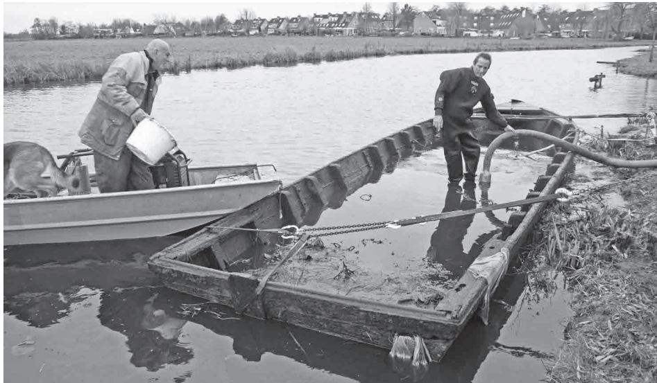
De berging van een oude koeienpraam in volle gang.

In december 2017 werd door een bergingsbedrijf, in opdracht van de gemeente en in samenwerking met het Hoogheemraadschap, een verweesde oude boerenpraam opgeruimd.