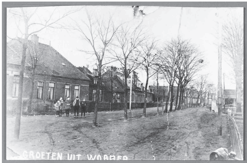
De Dorpsstraat richting Jisp omstreeks 1920 met in het midden het blokje huizen waar nu de Beschuitstoren staat.