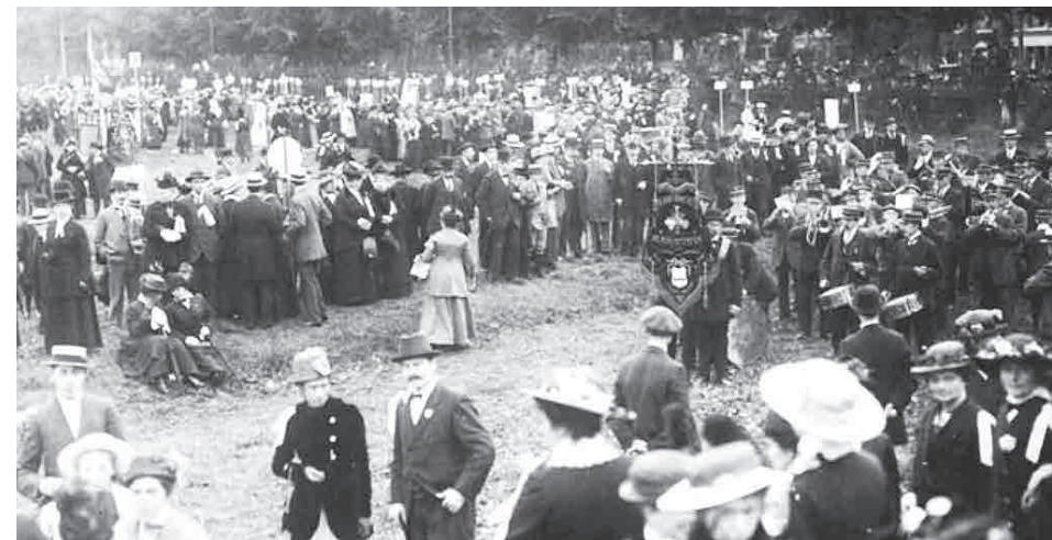
Betoging voor vrouwenkiesrecht in Amsterdam in 1916.

Haar betrokkenheid bij dergelijke dagelijkse besommeringen van de mensen in Wormer was waarschijnlijk ook de reden dat zij actief was voor de afdeling Wormer van het Centraal Genootschap van Kinderherstellings- en Vacantiekolonies. Zij was daarvan jarenlang penningmeesteres, in 1922 tot tevredenheid van haar