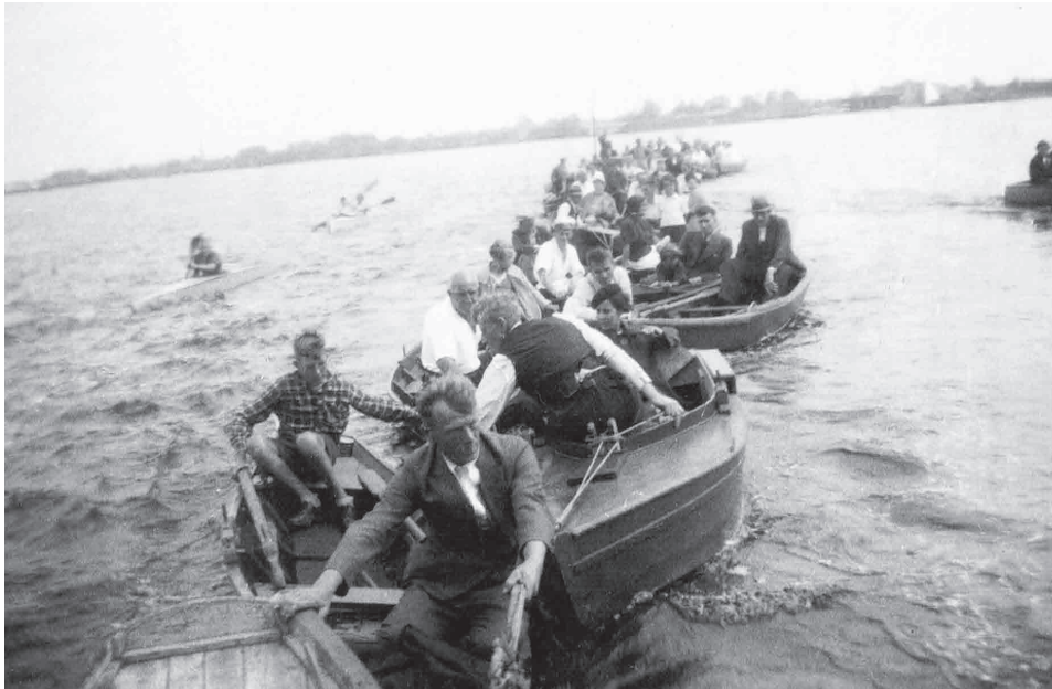
Op weg naar het eiland Kneppelsoord.