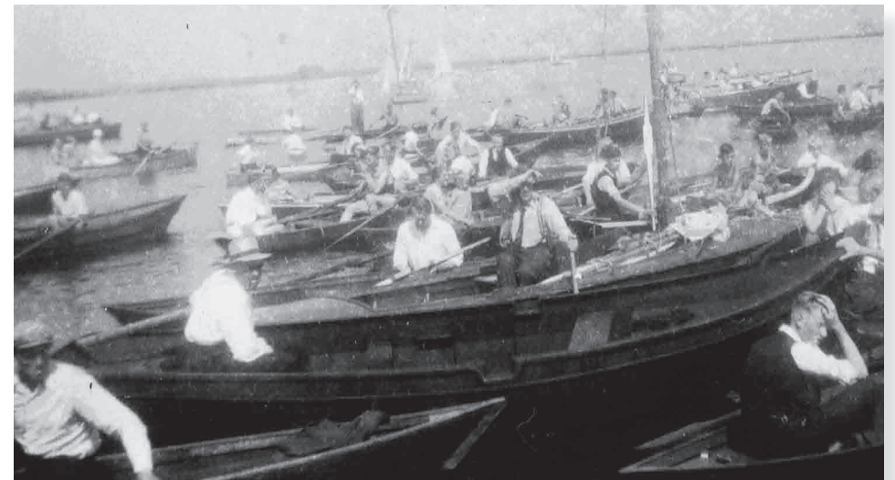
Begeleidingsboten liggen klaar voor de zwemtocht naar Kneppelsoord.

In 1967 werd het bad door een storm zwaar beschadigd. In 1970 werd het gesloten vanwege de slechte kwaliteit van het zwemwater. Reeds in 1967 besloten de besturen van de beide zwembaden om te gaan samenwerken.