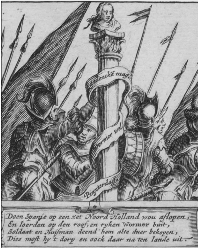
Deel van een gravure uit 1648, gemaakt bij gelegenheid van een optocht door Wormer ter ere van de vrede van Münster in dat jaar. Let op het lint om de zuil met het opschrift "Pinxsterdag Wormer wel gedencke mag."

mand over. En dat wonder was so en warender van de Staetsche (geuzen/opstandelingen) niemand dood nog gequest. Dit volbragt voeren se terstond over, en vervolgden de Spaensche die se nog aen een grote Wateringe besetten. Daer sprongen se by menigte in 't water en versopen. Twee-hondert en negentig wierden der gevangen. Daer elk Soldaet vier of veyf aen een tou hadde gekoppelt en bragtense als Lammeren na Wormer." 3)