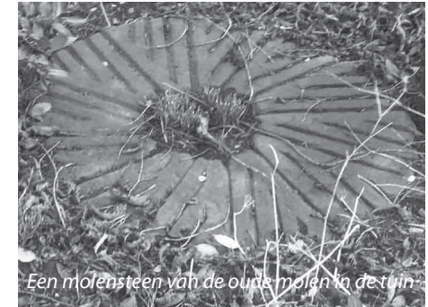
Een molensteen van de oude molen in de tuin

Bronnen: 1. Voorouders en bouwvergunningen Waterlands Archief; 2. Notariële aktes Meindert Donker (Zaans Archief); 3. Jac Jongert, Herinneringen van een boerenjongen , samengesteld door Erven Jongert, 1985-1986; 4. Website de Wormerlander. 5. Foto's: Waterlands Archief, en foto's huidige bungalow Het Vliegend Hert: Frans Koelemeijer.