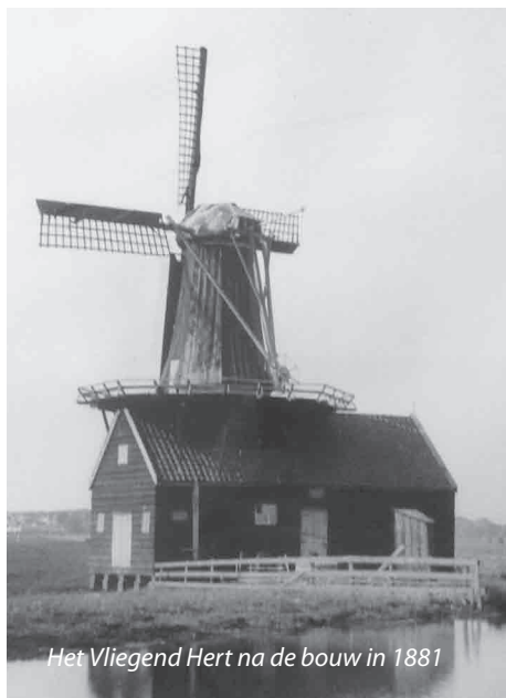
Het Vliegend Hert na de bouw in 1881

Doppenmolen langs de ringdijk van de Engewormer