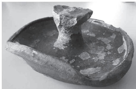
Boven: Het beschadigde olielampje, gevonden in 1964. Rechts: Een gaaf olielampje.