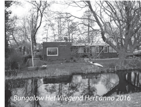
Bungalow Het Vliegend Hert anno 2016

In de jaren vijftig komt ook hieraan een einde - de molen is reeds in 1937 gesloopt - en verschijnt er op de plek van de oude molen en het tot woningen verbouwde pakhuis, een moderne bungalow. Het is de Koninklijke Papierfabrieken Van Gelder Zonen die in 1959 voor zijn personeel een vergunning aanvraagt voor de bouw van een bedrijfswoning. Anno 2016 staat deze woning er nog steeds, met de naam Het Vliegend Hert. De enige zaken die nog aan de geschiedenis van de doppenmolen Het Vliegend Hert herinneren, zijn de van de molen afkomstige molenstenen in de tuin van de bungalow.