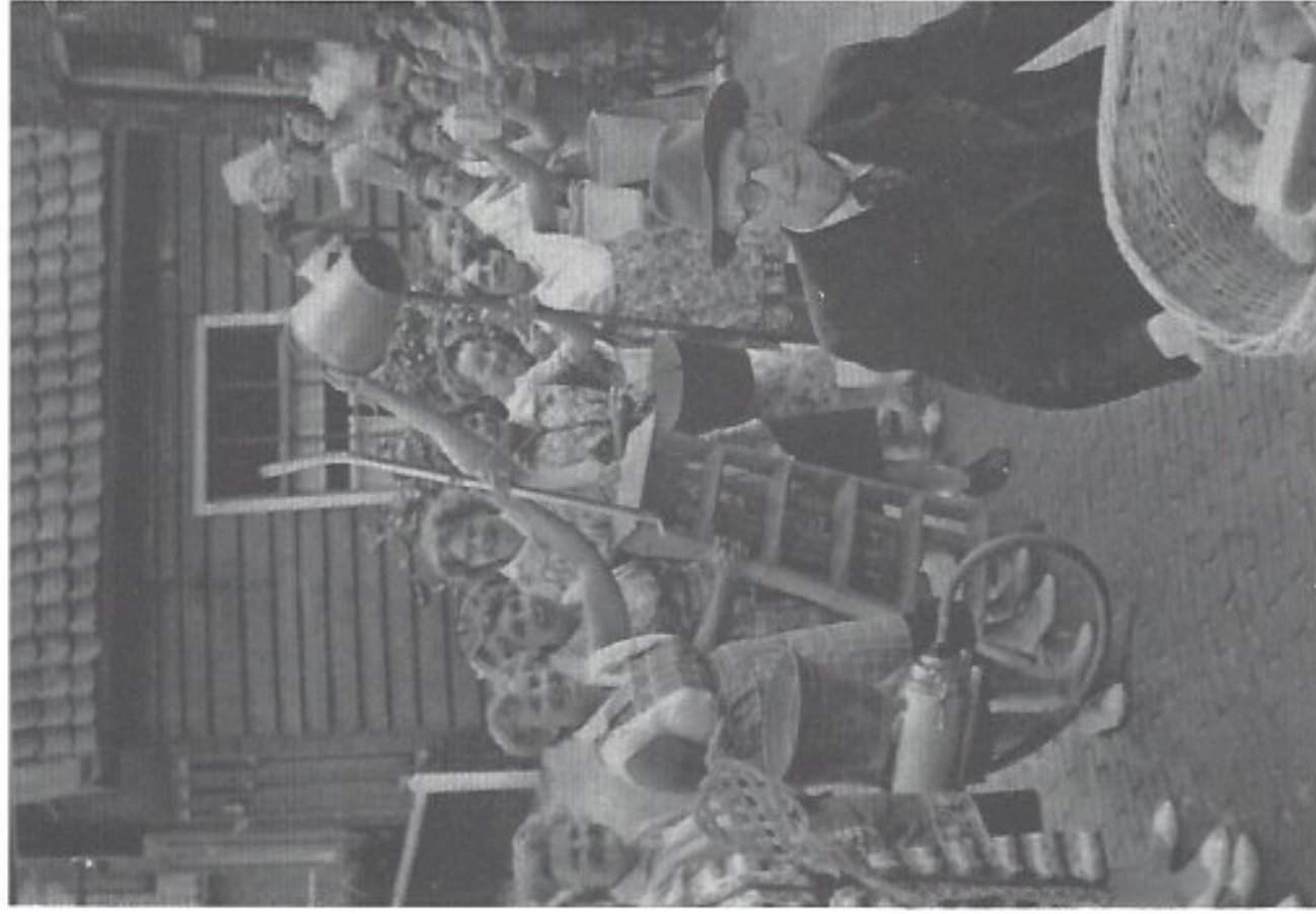
Torenklanker 35 pag.9