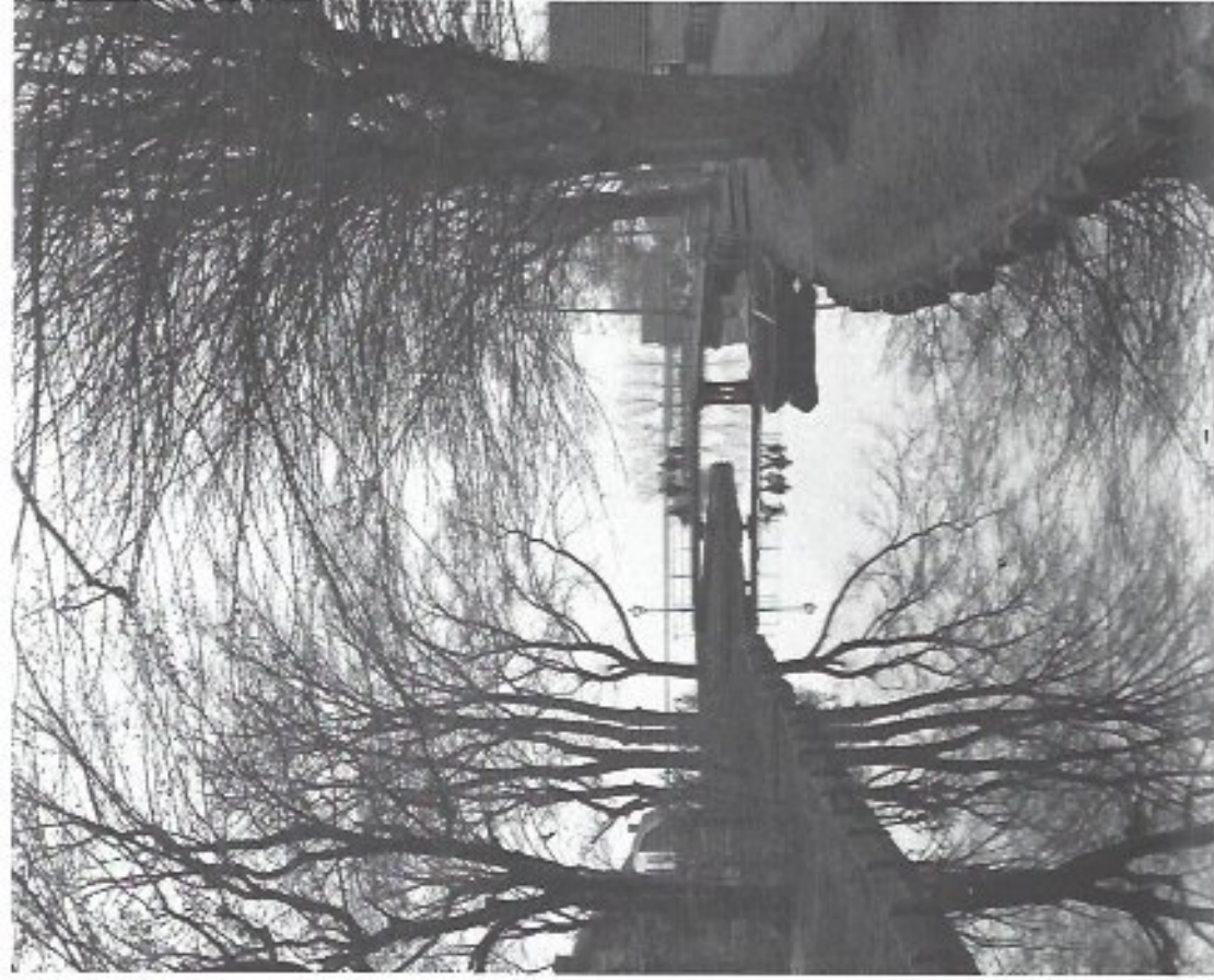
Wormer en Jisp bleven maar fermawernood gespaard tijdens de watersnoodramp van 1916.