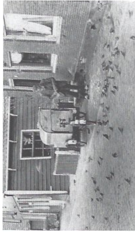
psg. 8 Torenklanker 35