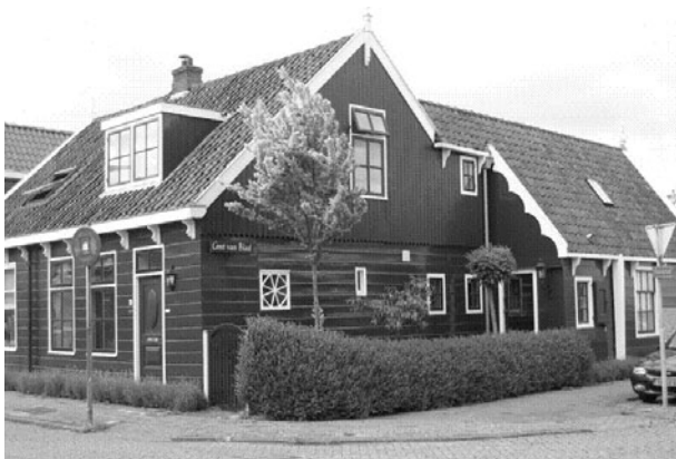
De arbeiderswoning annex kruidenierswinkel Cent van Blad anno 2008

Wormer kunnen zich het beste de grote sortering snoep herinneren die in het winkeltje van Hein Hille werd verkocht. De meeste kinderen die zondags naar de kerk gingen vergaten wel eens 'per ongeluk' om de cent, die zij gekregen hadden, in de collectebus te stoppen. Met de cent werd dan stiekem snoep gekocht in het winkeltje waar ook kruidenierswaren en textiel te verkrijgen waren. Keeswillem heeft van Kniertje Klopper een boodschappenlijstje gekregen die zij in 1933 had gemaakt voor Hein Hille. Kniertje vertelde Keeswillem dat aan de boodschappen op het lijstje te zien is dat ze toen zwanger was! Veel zoetigheid en beschuit staan erop.